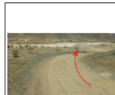
Trayectoria del vigilante en bicicleta por la rampa en bajada